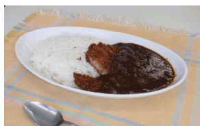
写真はカツカレー350円

学生食堂の定番メニュー、カレーライス。その味がスパイシーになったと評判です。カレーライスのほか、カツカレー、唐揚げカレー、ハンバーグカレーもあります。オープンスクールではカレーライスを味わっていただけます。お楽しみに!