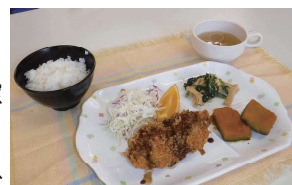
本日の広陵ランチはチキンカツ定食

「このクオリティーで300円!」と、話題を集めているのが、日替わりの「広陵ランチ」。価格、味、栄養バランスともにGood。コスパの秘密はPTAと同窓会とが生徒のためにと、資金を援助しているからです。関係者のやさしさが詰まった広陵ランチは、入学後に味わってください。